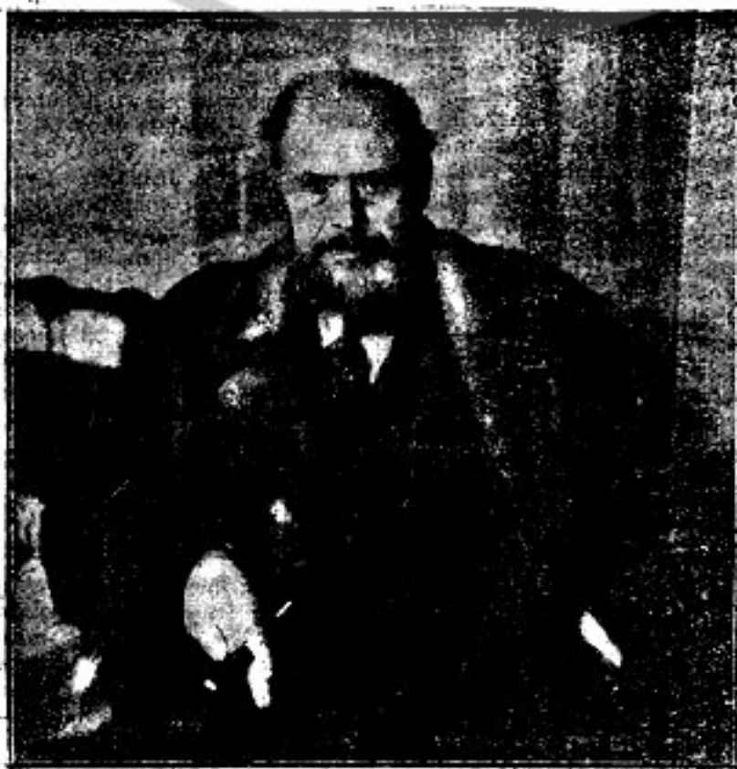
KAZIMIERZ PRZERWA TETMAJER

nie może nikt stworzyć nic, coby nie było nim i w nim”. Szczere złoto dał nam Kazimierz Tetmajer w dziełach Swoich, bo szczerzoty jest Jego talent i umysł wzniosły, i duch górny. Za wzbogacenia skarbnicy narodowej myśli twórczej i dorobek chwaly imienia polskiego na obczyźnie — hold przyziemny Mu należy!